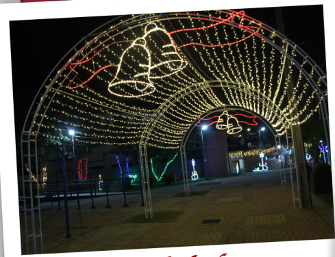
T nel de luzes