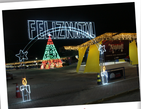
Entrada da Praça