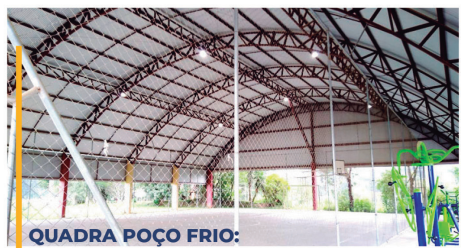
QUADRA POÇO FRIO: ✓ MANUTENÇÃO E COLOCAÇÃO DE LÂMPADAS DE LED.