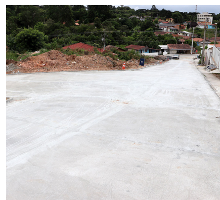
Rua Gralha Azul

Este investimento vem recebendo grande aprovação dos moradores, fato este que assegura a prefeitura para ampliar esta frente de trabalho para mais bairros.