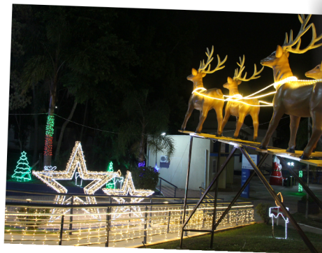
Renas e estrelas