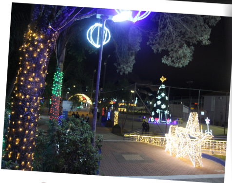
Centro da praça