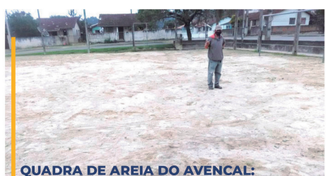
QUADRA DE AREIA DO AVENCAL: ✓ LIMPEZA, MANUTENÇÃO, CONserto DE TRAVES E COLOCAÇÃO DE AREIA.

QUADRA CAMPINA DOS MAIA: ✓ MANUTENÇÃO (LAVADO) E TROCA DE LÂMPADAS.