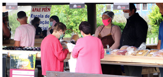
Comunidade tem aproveitado a oportunidade