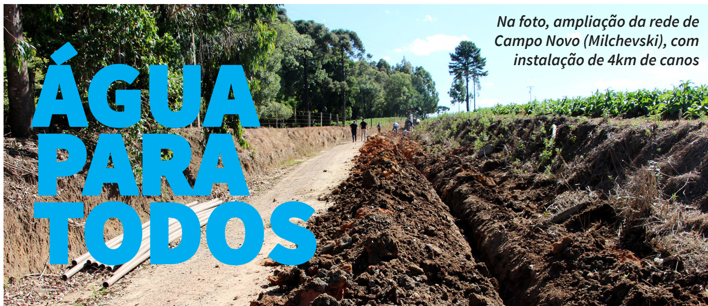
Na foto, ampliação da rede de Campo Novo (Milchevski), com instalação de 4km de canos