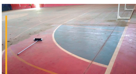
GINÁSIO DE TRIGOLÂNDIA: ✓ LIMPEZA E MANUTENÇÃO.