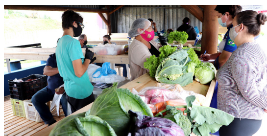
Agricultura familiar presente na feira

O objetivo é manter a feira mesmo após o período natalino, sempre nas sextas-feiras, das 16 às 22 horas.