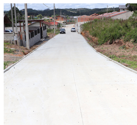
Rua São Carlos