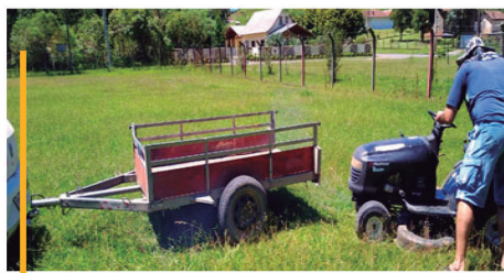
CAMPO CAMPINA DOS MAIA: ✓ CORTE DE GRAMA.

As quadras poliesportivas também estão recebendo atenção, como limpeza, troca de iluminação e diversas ações que visa deixar estes espaços em condição de uso.