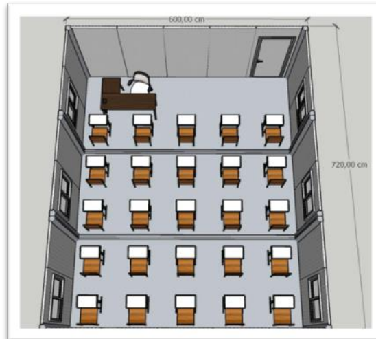
Figura 3 - Perspectiva superior com as medidas mínimas da sala de aula