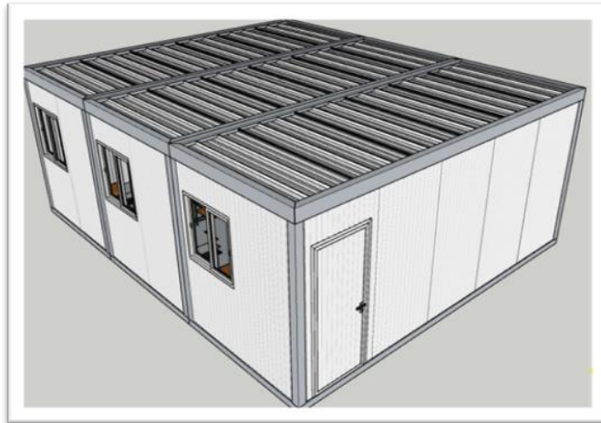
Figura 1 – Perspectiva da sala de aula comporta por 3 módulos