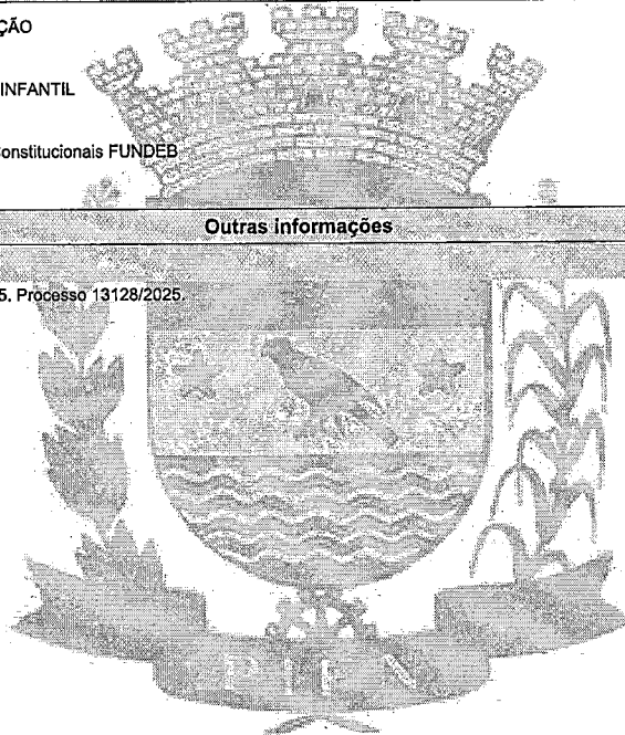
CLARICE DE FATIMA FRAGOSO

Viagem a Curitiba com os alunos dos 5º anos, dia 10/12/2025. Processo 13128/2025.