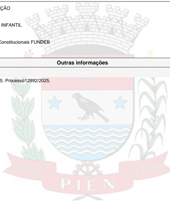
CLARICE DE FATIMA FRAGOSO

Viagem a Curitiba com os alunos dos 5º anos, dia 10/12/2025. Processo12992/2025.