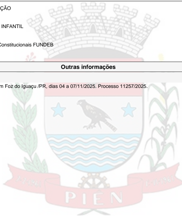
CLARICE DE FATIMA FRAGOSO

Participação do Fórum Extraordinário 2025 - UNDIME PR, em Foz do Iguaçu /PR, dias 04 a 07/11/2025. Processo 11257/2025.