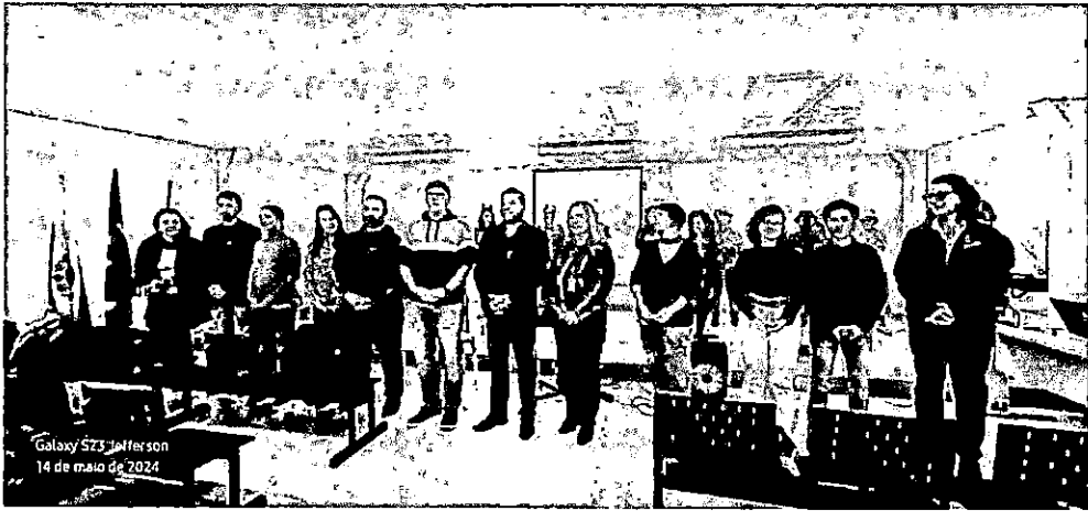
Galaxy 573 Jefferson 14 de maio de 2024