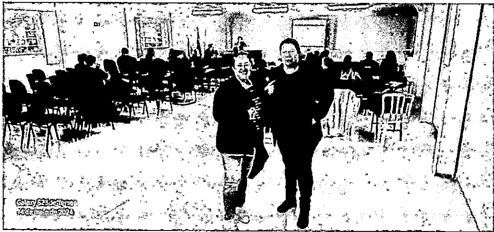
Galaxy 573 Jefferson 14 de maio de 2024