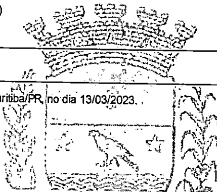
MAICON GROSSKOPF PREFEITO

Histórico _____ Curso de Capacitação em Pavimento Rígido, em Curitiba/PR, no dia 13/03/2023.