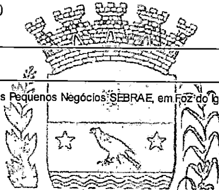
MAICON GROSSKOPF PREFEITO

Participação no Encontro Estadual dos Comitês dos Pequenos Negócios SEBRAE, em Foz do Iguaçu/PR, nos dias 06 a 10 de novembro de 2022.