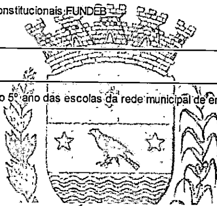
MAICON GROSSKOPF PREFEITO

Acompanhamento na aula de campo dos alunos do 5º ano das escolas da rede municipal de ensino, em Curitiba/PR, no dia 28 de novembro de 2022.