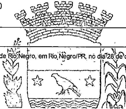
MAICON GROSSKOPF PREFEITO

Participação em Audiência no Fórum da Comarca de Rio Negro, em Rio Negro/PR, no dia 28 de outubro de 2022.