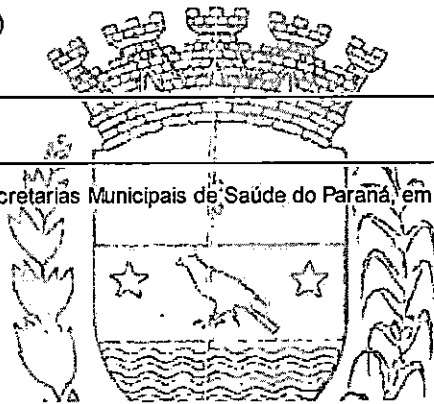
MAICON GROSSKOPF PREFEITO

Participação no XXXVI Congresso Estadual de Secretarias Municipais de Saúde do Paraná, em Foz do Iguaçu/PR, nos dias 17 a 20 de outubro de 2022.