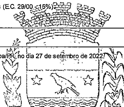
MAICON GROSSKOPF PREFEITO

Participação na "Reunião Planifica SUS", em Curitiba/PR, no dia 27 de setembro de 2022.