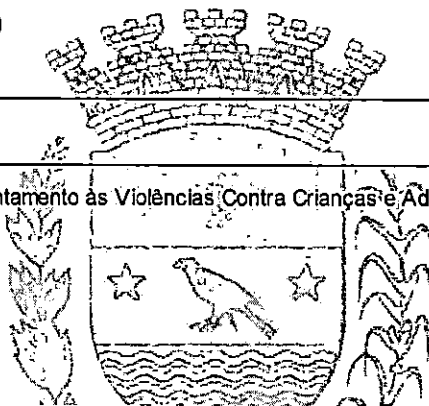
MAICON GROSSKOPF PREFEITO

Encontro da Rede de Proteção Municipal de Enfrentamento às Violências Contra Crianças e Adolescentes - Tema: Revelação Espontânea, Em Curitiba/PR, no dia 24 de agosto de 2022.