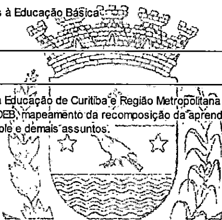
MAICON GROSSKOPF PREFEITO

Reunião presencial dos Secretarios Municipais da Educação de Curitiba e Região Metropolitana na cidade de Curitiba/PR. No dia 10 de agosto de 2022. Pauta: Piso salarial, profissional de apoio, IDEB, mapeamento da recomposição da aprendizagem de Curitiba e Região Metropolitana, para futura apresentação aos prefeitos no Pró-Metrópole e demais assuntos.