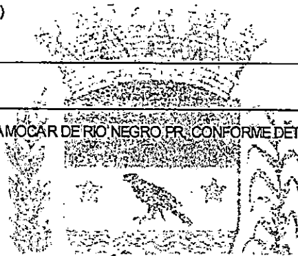
MAICON GROSSKOPF PREFEITO

Histórico AUDIENCIA NA 1 PROMOTORIA DE USTIÇA DA CAMOCAR DE RIO NEGRO PR - CONFORME DETERMINAÇÃO DIA 27/07/2022